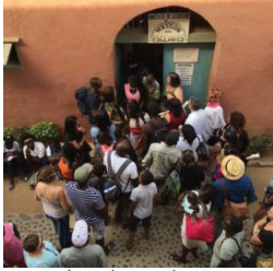
بيت العبيد، السنغال

موقع الضمير هو مكان للذاكرة - متحف أو موقع تاريخي أو نصب تذكاري أو مبادرة للذاكرة - يواجه تاريخ ما حدث هناك من جهة و الإرث المعاصر الناجم عنه من جهة أخرى.