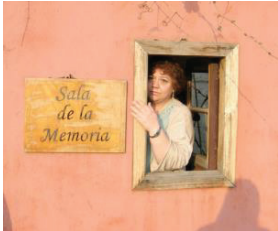
منزله فيلا غريمادي للسلام، تشيلي