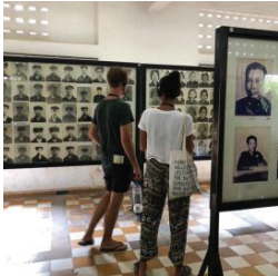
متحف الإبادة الجماعية في توول سلينغ - كمبوديا

لواقع الضمير يولف الداخن الكلاما لويحتل اهدجهو سر ركتي تلا فديوحلا فيملاعلما مكشبلما وه فركاذلا عقامو توفرنأ فالحاكتلا يدرك بي ندمل معلما زيزعتي عل متقو تا حاسم يلا في ضاملا ظفحتي تلا ان. فهذيتاوملا كارشأ نامض و ناسنلا قدمة حقوقي د فمعتم كيتكنك اهر يخست بجبل ب، لتصائم تسيل مكرحل مز عيمو ما يهل معلاب فركاذلا و رضاحلاب في ضاملا طبري عل معدي ذلا في عاولا هذجلا واقعه من من رتكا مة تضكشيك و الضمير 275 في ريملضلا عقن 65 مويلايما تارك عشار شاي مقودن حذ، ملود دعون و تيطار قمديلا ماما تدياكتلا نأشيد تاءارجا ناكتلا لاريخ من أجتلا سوردم ادختسا يويًا فندس انلا ملافتخا اننا أمك. جويلا ناسنلا قحقوي عل صاخشلأ نبيد معجت ي تلا قويلا ميكتشارتلا جماربلا للاخ من و، تيطار قمديلا و ناسنلا قحقول من أجتضالان تهدش تلا نلاما في عل ظافلا في فمعتم لك قديلا ليكتشور و نونفا و ثارتلا و فركاذلا و في ريخست في قحلا و الكنه يرا جمة عار صبدتحتلا تصويلا في عسة تيقلاخا تاعمتجا منب ي قافة فتلا. مينا سنل و ملاعد رتكال لقبتم