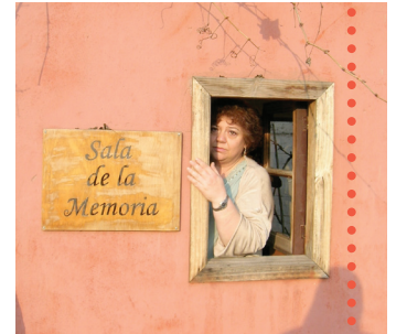
Parque por la Paz Villa Grimaldi, Chile